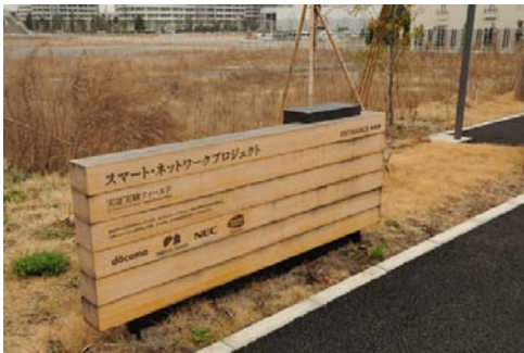
アプローチに設置されている木製看板