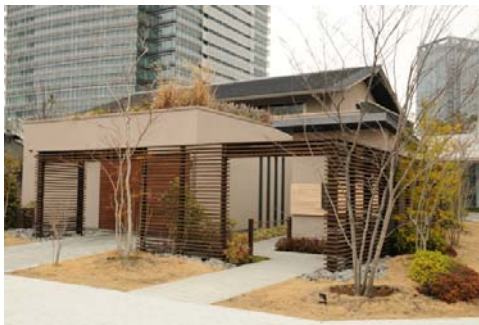
観環居外観（アプローチ方面より）