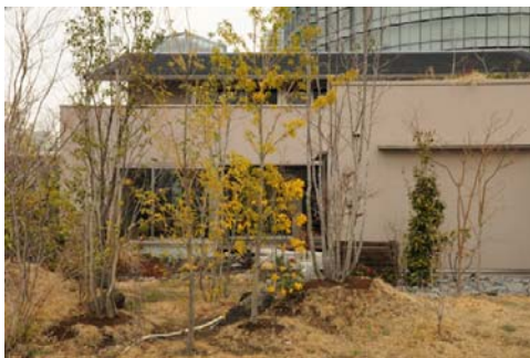
観環居外観（庭側より）