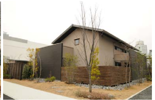
観環居外観（北東側より）