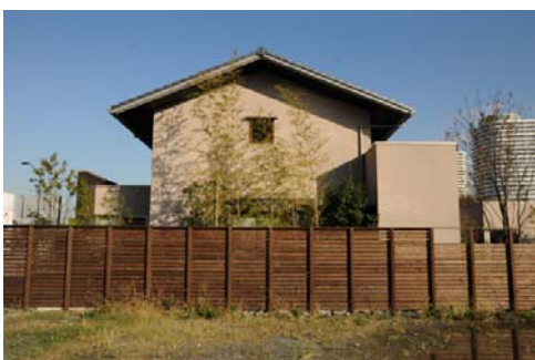
観環居外観（西側より）