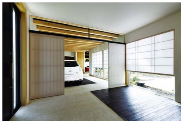
室内に設けられた電気自動車専用ガレージは多目的に使用可能