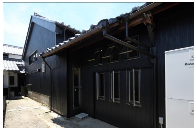
焼き杉風の建材で街並みや景観に調和する外観を創出。