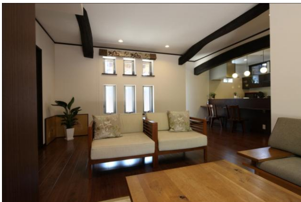
適切な開口部と建具で通風による快適性が向上。