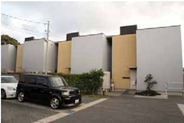
集合住宅ゾーンNまちなみ