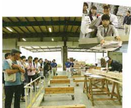
構造材や断熱材の工場を訪ねるツアー