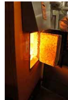
ペレットが燃えている様子