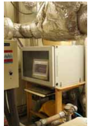
コントロール用パソコン