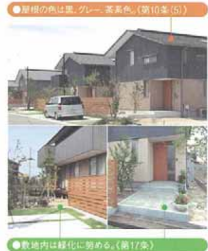
建築協定と環境協定の例