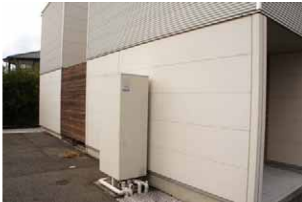
地域集中冷暖房システムによる給湯器