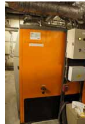
集中型ペレットボイラー