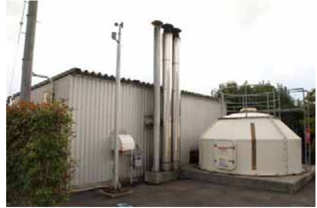
集中型ペレットボイラー設備（左）とペレットサイロ（右）