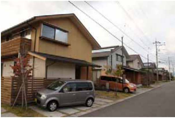
安岡エコタウンのまちなみ