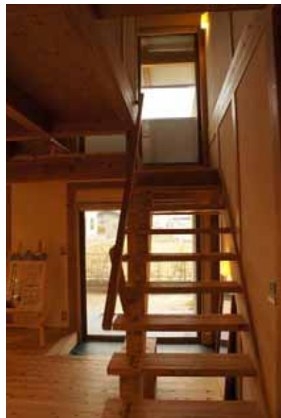
階段の折り返し部分にも開口部が設けられている