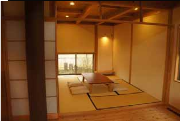
居間に設けられた地窓