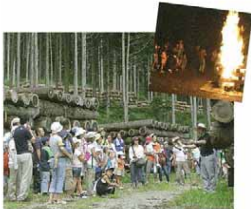
柱・梁の産地を訪ねるツアー