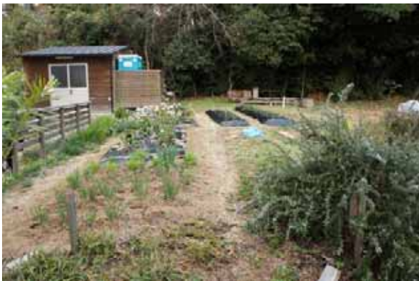
約 300 坪のえこ畑