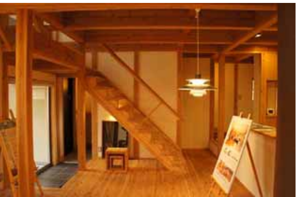
柱・梁が現しとなっている内部