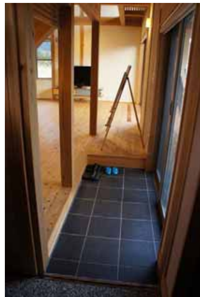
玄関横に設けられた土間スペース