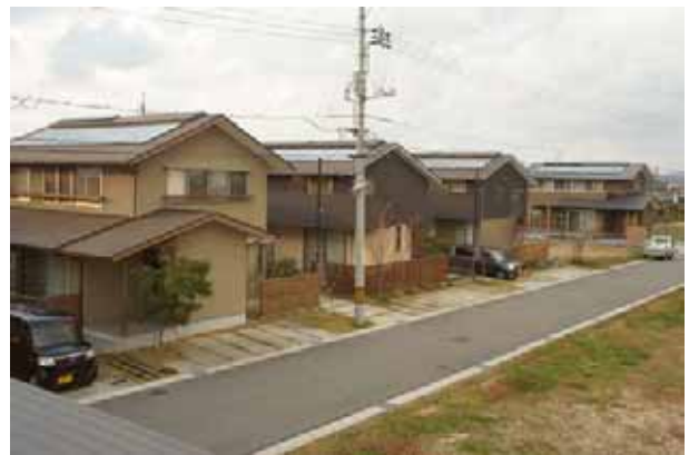
安岡エコタウンのまちなみ