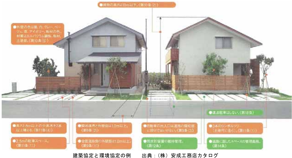
建築協定と環境協定の例