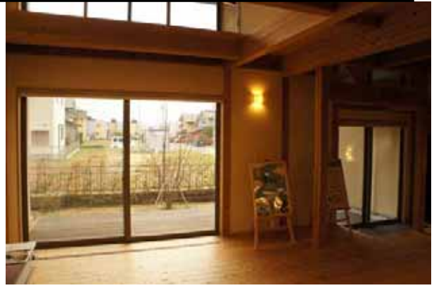
大きな開口部と吹き抜けによる開放的な空間