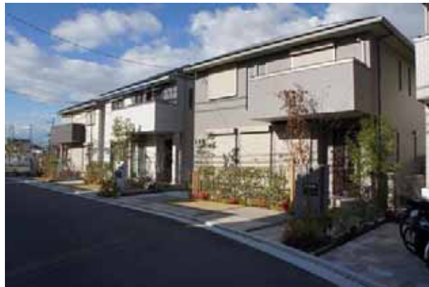
スマートシティ堺・初芝のまちなみ