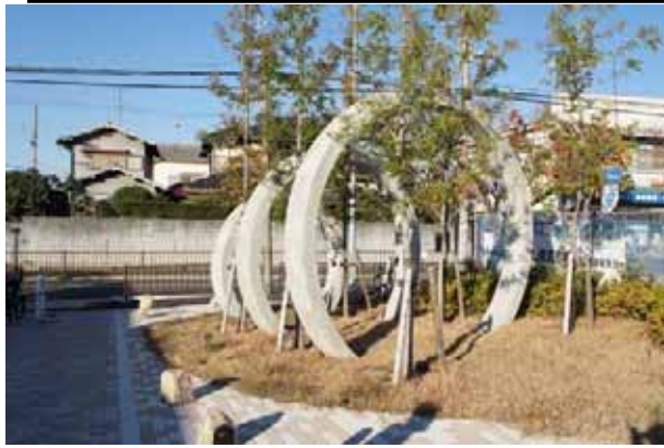
ロータリーの円をモチーフとしたゲートパークのオブジェ