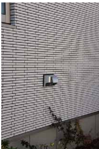
全邸に搭載された電気自動車の充電プラグに対応する EV 充電用屋外コンセント (200V)