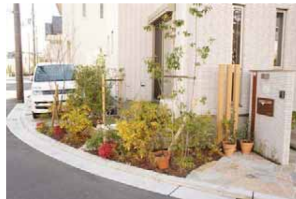
コーナー部分の豊かな緑化