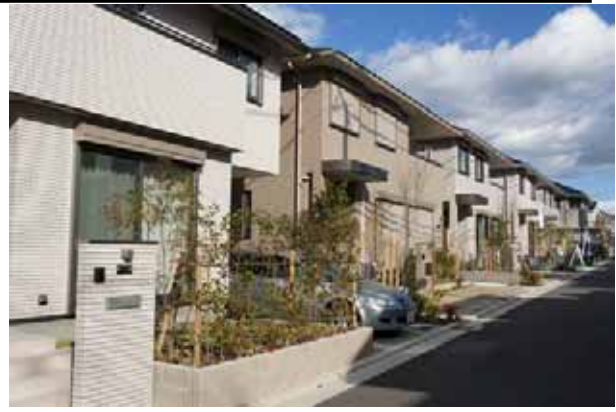
スマートシティ堺・初芝のまちなみ