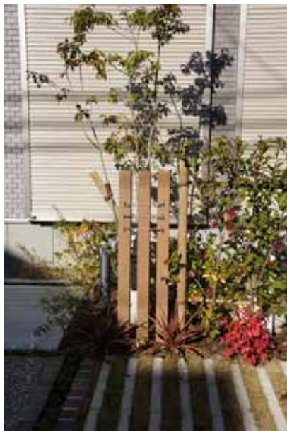
玄関周りの植栽用フック