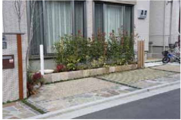
カーポートの緑化