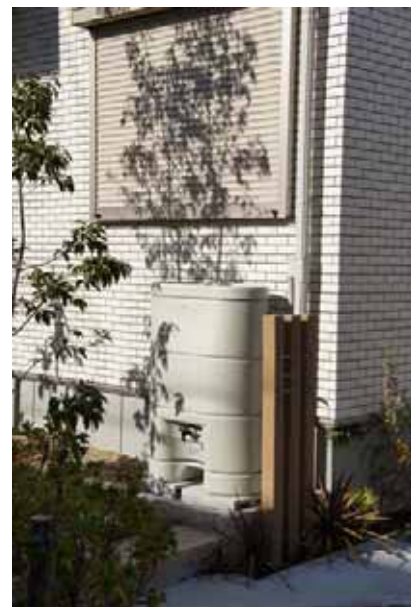
全邸に搭載された雨水タンク