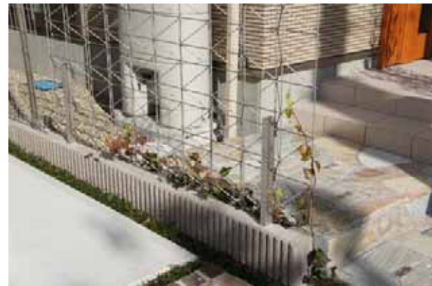
敷地境界に設置された緑化トレリス