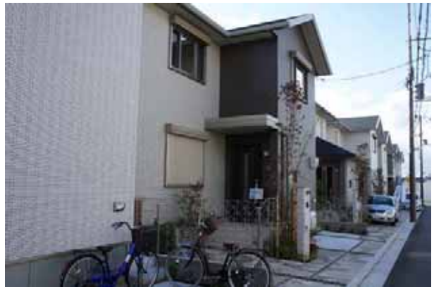
スマートシティ堺・初芝のまちなみ