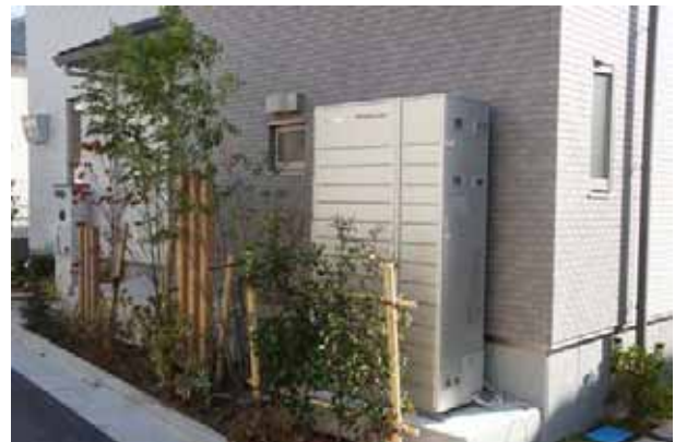
全邸に搭載された都市ガスを利用して発電する創エネ設備