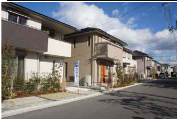
スマートシティ堺・初芝のまちなみ