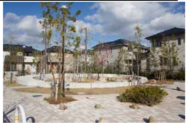
ロータリーの円をモチーフとしたセントラルパークのしつら