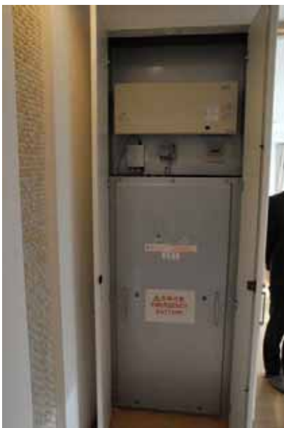
クローゼット内に収納されている鉛蓄電池とその上部のパワーコンディショナ