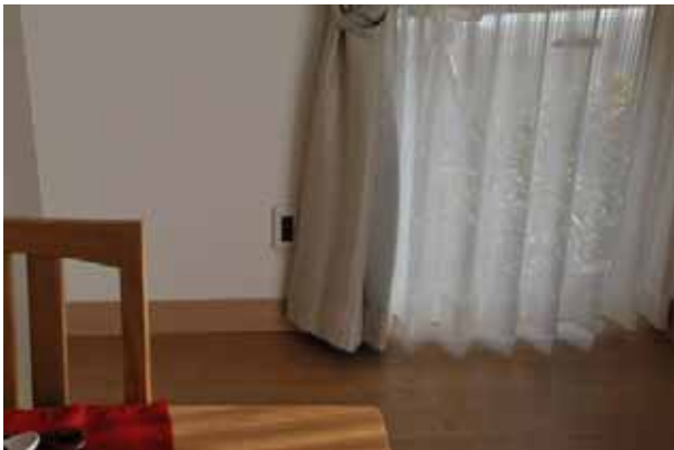
LDK に設置された自立運転時用コンセント