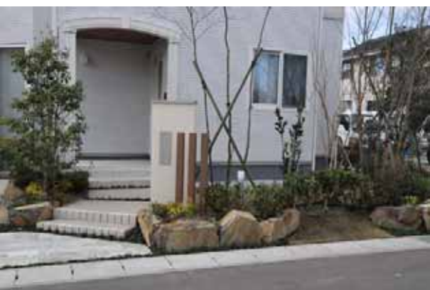
豊かに緑化された玄関周辺の空間