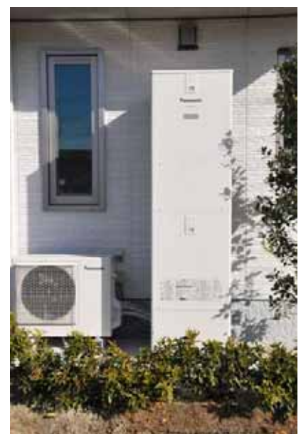
ヒートポンプ給湯器