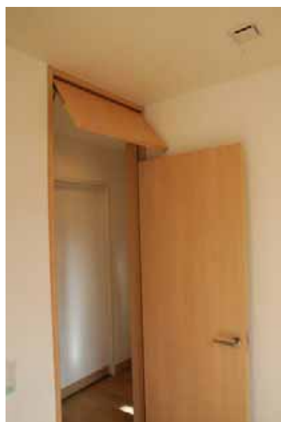
通風換気に配慮された建具上部の可動式欄間