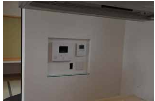
壁面に窪みをつけて設置された情報盤