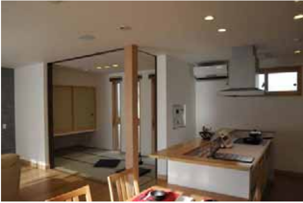
つながりのある開放的な室内空間