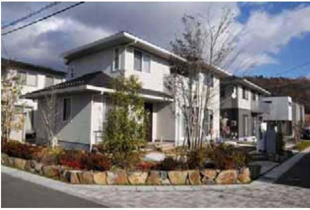
スマートコモンシティ明石台のまちなみ