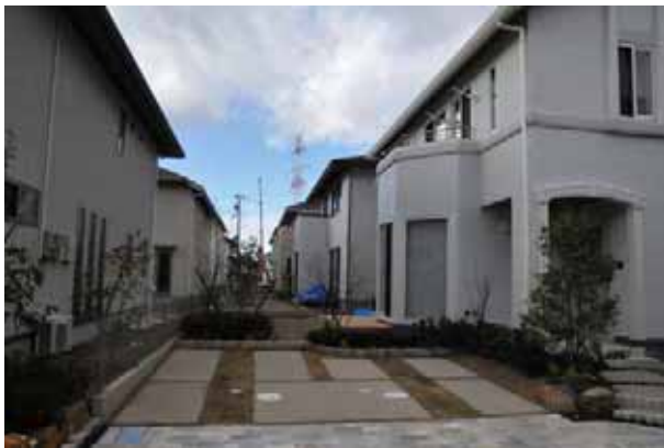
緑化されたカーポート