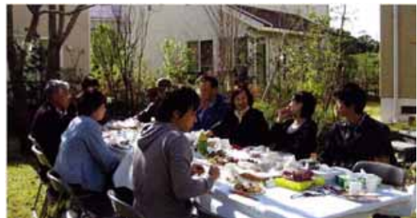
「イベントを通じて広がるコミュニティ」

積水ハウスでは、地域コミュニティを「ひとえん」と呼んでおり、「隣人祭り」と呼ばれる地域住民の集まりを仕掛けたり、セキュリティを重視したまちづくりとして警備会社によるパトロールなど、