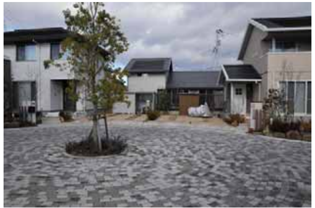
クルドサック周りのまちなみ