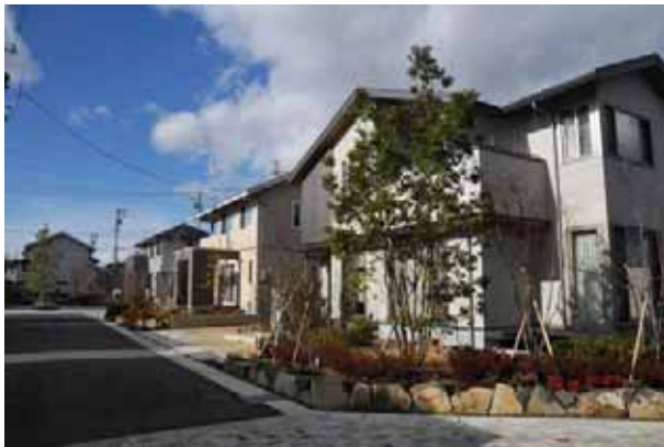
外構に共通して使われている地元産の伊達冠石