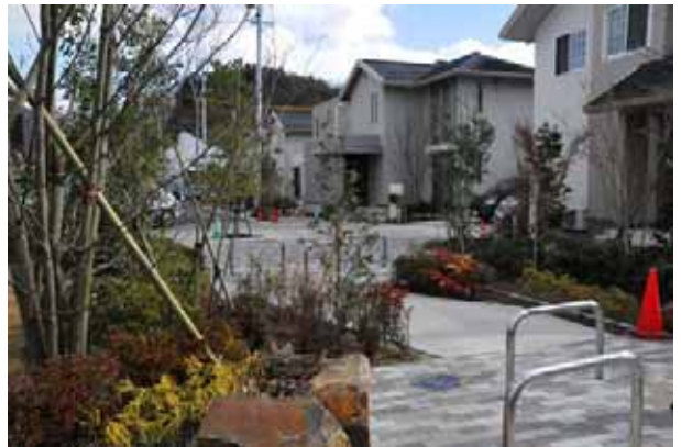
クルドサックと街路をつなぐ歩行者空間