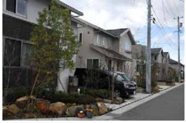
スマートコモンシティ明石台のまちなみ