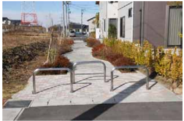
遊歩道を整備した歩行者ネットワーク