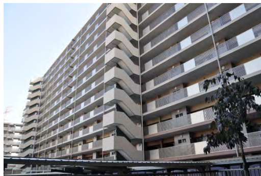
図 3-2-3-1 建物外観

答：高齢者は、近隣の戸建住宅に住んでいたが、利便性の高いマンションを希望され移住してくる方がいる。地域内で住み替える方も多く、それぞれの世帯のニーズに合わせた住宅を提供できるよう開発やその後のサービスを提供している。