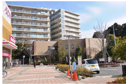
マンションに隣接した商業施設(スーパーマーケットや医療モール)。居住者は、駅前立地の利便性を享受。