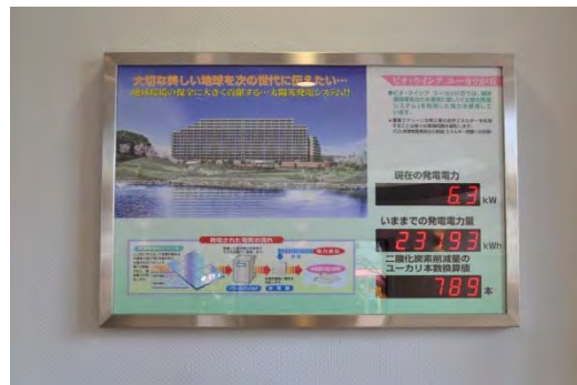
屋上に設置した太陽光発電の発電電力量の表示パネル(エントランスホール)。総発電量を樹木に換算。