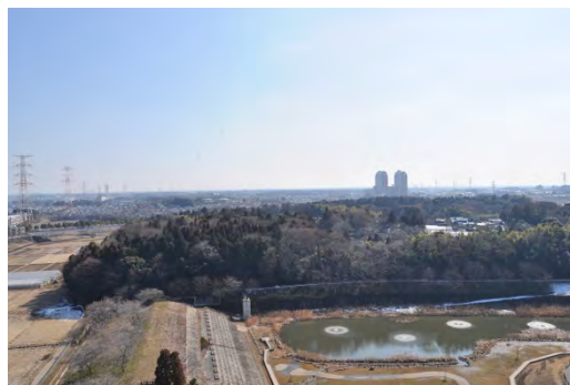
図 3-2-3-3 マンション南側の親水池と従来から残る杜

答：ビオ・ウイングの場合は、駅前の立地でありながら既存の自然環境や公園なども隣接していることや、マンションならではの共用施設の充実度などもアピールしている。既存の自然環境については、開発区画から外しているため昔の街の記憶が残されており、子供たちに伝えていく役割も果たしている。