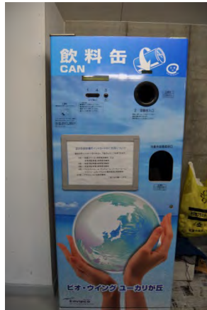
図 3-2-3-2 空き缶のリサイクルボックス