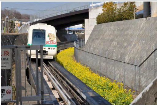
ユーカリが丘の地区内を走る「ユーカリが丘線」(新交通システム)。