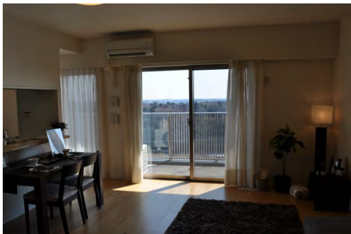
モデルルーム内。全戸南向きで前面は緑地公園となっているため、採光が確保しやすくなっている。