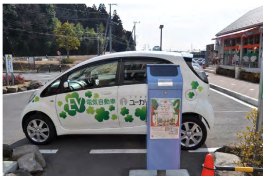
図3-2-3-4 駅前のスーパーの駐車場に設置されている充電スタンド

答：街全体では、これからも宅地の開発を進め居住人口が増えていくこと、また高齢化が進行していくことから、より細かい循環が可能なバス（電気）を利用した交通システムを検討中であり、すでに実験を行ってきている。また、電気自動車のカーシェアリングも実施しており、エコステーション（充電施設）の整備も始めている。