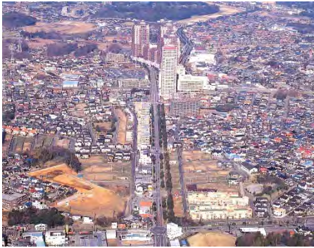
高層ビルが密集する駅前の商業施設とその奥に広がるユーカリが丘の住宅地。