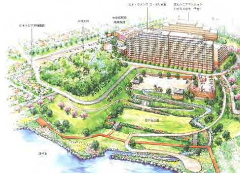
「バイオ・ウイングユーカリが丘」が立地する中学校駅前の環境共生をテーマにしたまちづくり。