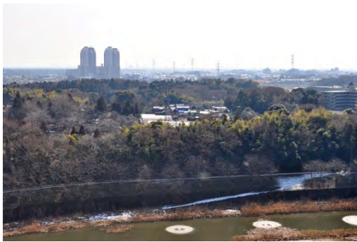
京成線駅前の立体開発(超高層)と、その背後に住宅地の平面開発を基本的な都市計画プランとして開発を実施。