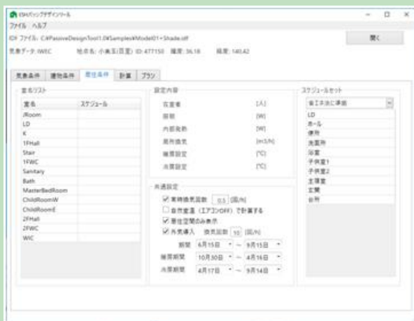
ユーザーインターフェイス／居住条件の設定画面