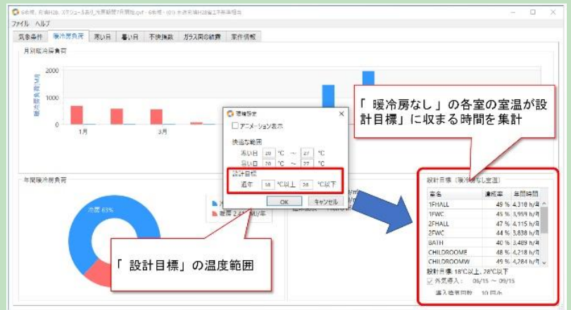
出力結果の例／暖冷房負荷