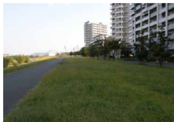
敷地とスーパー堤防のつながり