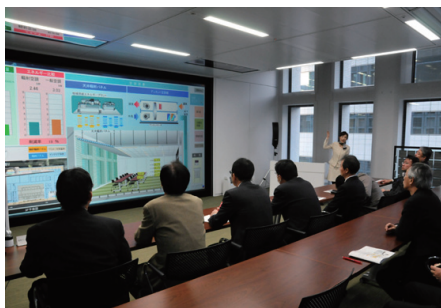
モデルオフィスでの説明（省エネと快適性の両立）