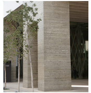
杉板（型枠）の木目が転写されたコンクリート