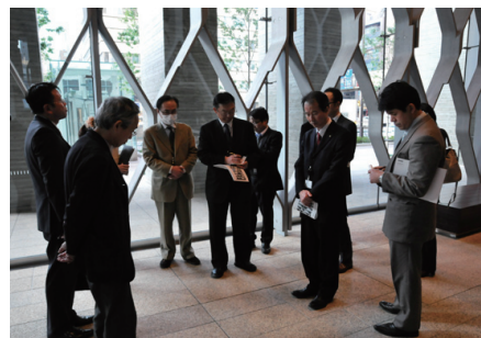
エントランスホールでの説明