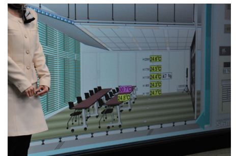
温度ムラの少ない空調