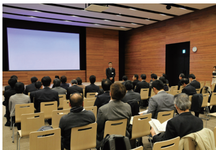
清水建設様による説明