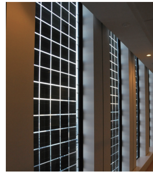
多結晶型太陽光パネル (共用部)